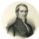
Louis-Joseph Gay-Lussac 1778-1850