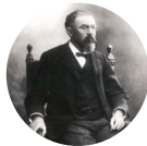
Jules Henri Poincaré 1854-1912

Químico e Físico francês. Ele é principalmente conhecido pelas suas descobertas nas características dos gases.